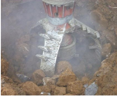
低速回転・高トルク