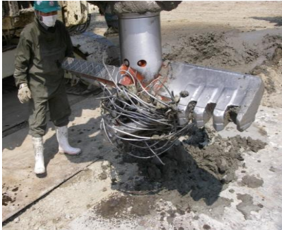
耐衝撃・耐摩耗 (Taf仕様)