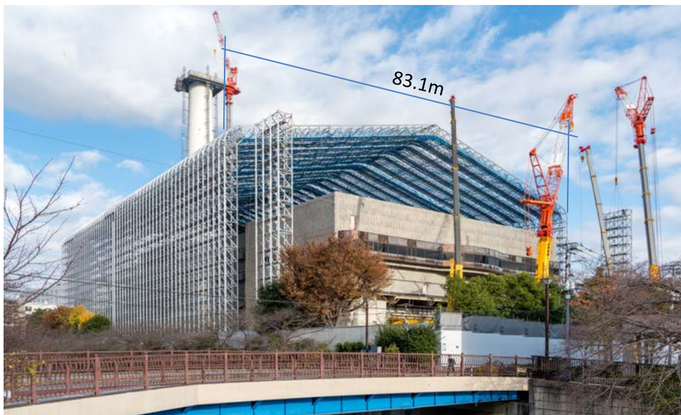
アトモス建設状況