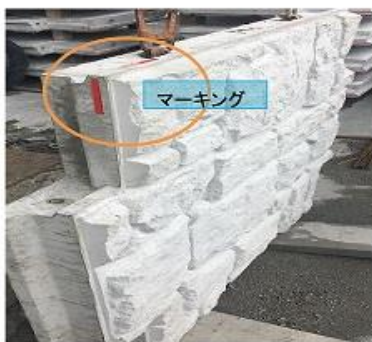
c) 変状サイン(マーキング)