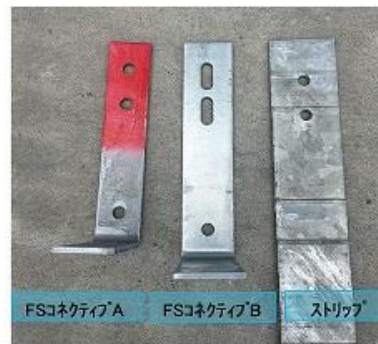
b) FSコネクティブ形状