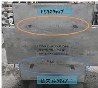
a) FSコネクティブ配置