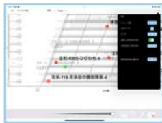
過去点検表示選択