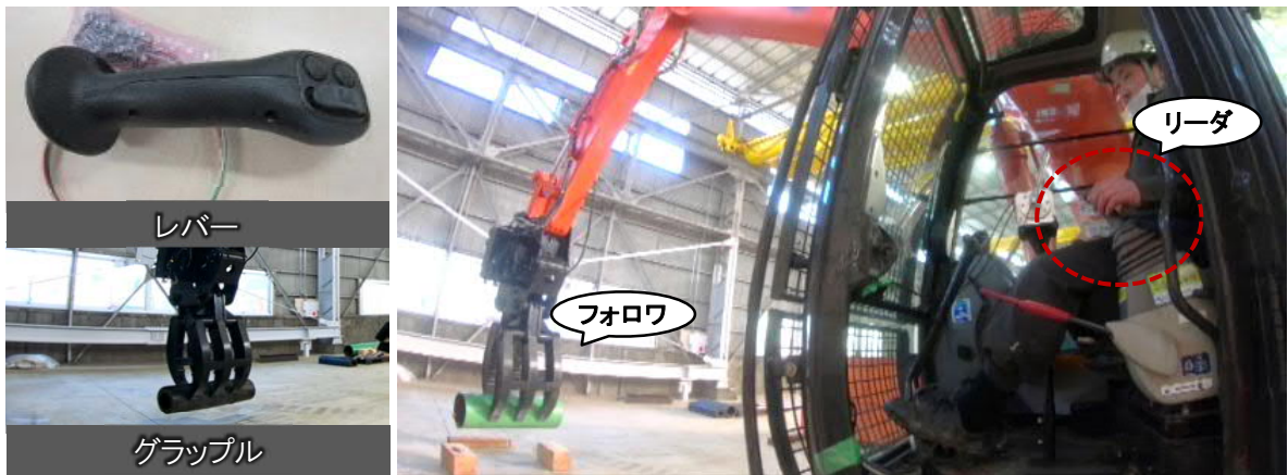
油圧駆動建設機械の適用実験の様子