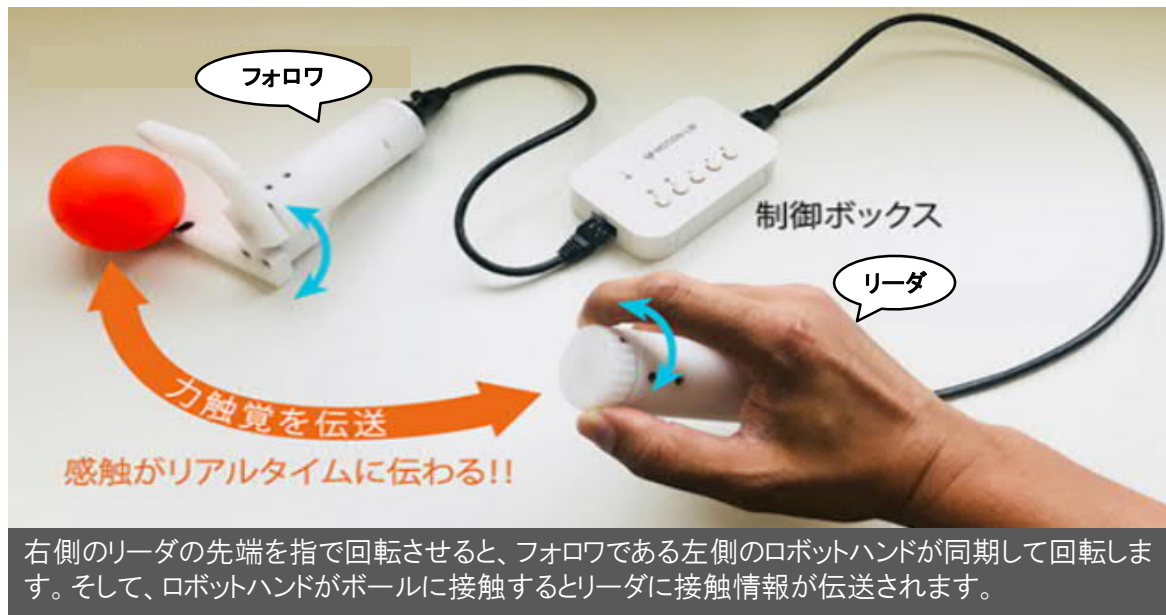
リアルハプティクス技術の例