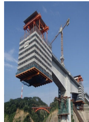
超大型移動作業車