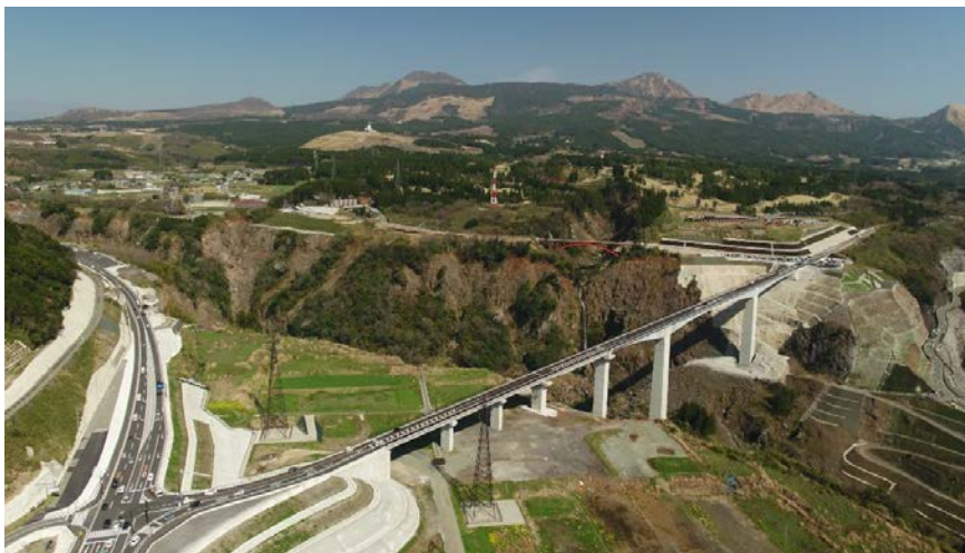
新阿蘇大橋 完成写真