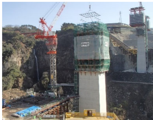
クライミングシステム