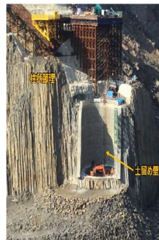
新工法による 柱状節理の保全