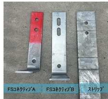
b) FSコネクティブ形状