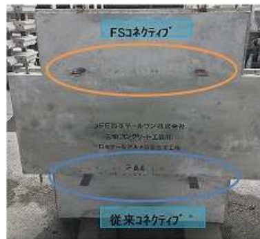
a) FSコネクティブ配置