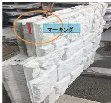
c) 変状サイン(マーキング)