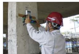
表層引張試験状況