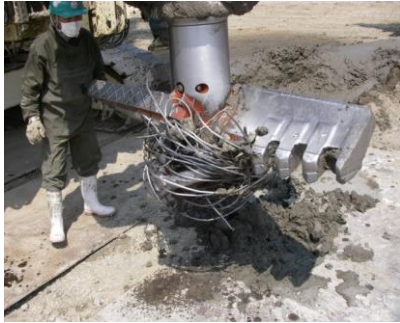
耐衝撃・耐摩耗 (Rock仕様)