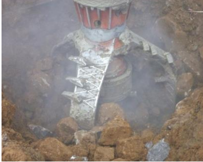
低速回転・高トルク