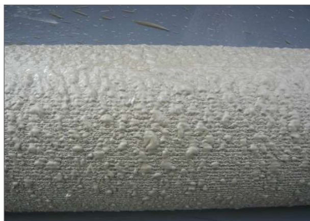
図-4 注入後のパッカー表面