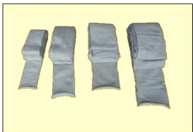
図-2 ロックボルトパッカー