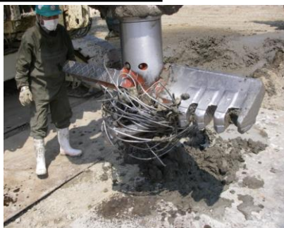
耐衝撃・耐摩耗 (Rock仕様)