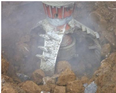
低速回転・高トルク