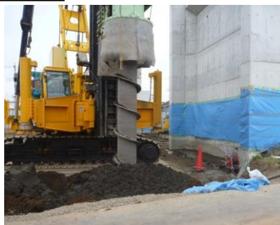
低速回転・スパイラルロッド